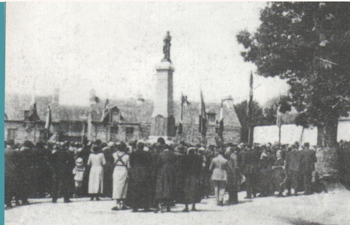
L'inauguration du Monument aux morts de Paimpont en 1924

Le monument aux morts est inauguré le 15 juin 1924 sur la « Place de l'église ». Sa construction a été retardée par les nombreuses vérifications administratives concernant l'état civil des noms à inscrire. 140 des 157 Paimpontais figurant sur la « liste des noms à graver sur le monument au mort » sont finalement retenus. L'obélisque réalisé par Jules Hignard est surmonté d'une statue d'un poilu du sculpteur Jules Pollacchi. Le monument, orné de deux canons de 58, est entouré de chaînes en fer forgée reliant 8 obus de 270, mis gratuitement à disposition par le ministère de la guerre.