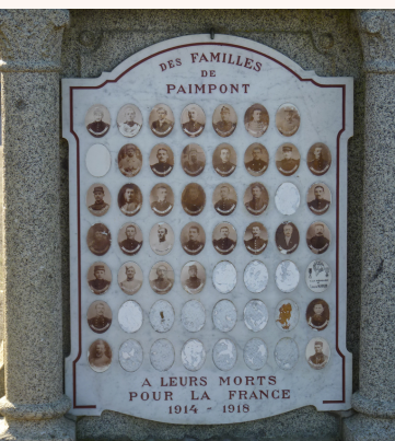
Le tableau commémoratif du cimetière

Un « Tableau commémoratif de la guerre 14-18 » expose les photographies de 55 des 140 Paimpontais « morts pour la France » sur un tableau de marbre érigé au centre du cimetière. Ce monument daté de 1924 est réalisé par une entreprise nantaise qui propose aux familles « de remplacer les tombes des malheureux tombés au champ d'honneur », moyennant finance. La commune de Paimpont s'est désolidarisée de ce monument en raison du caractère partiel et commercial de l'entreprise.